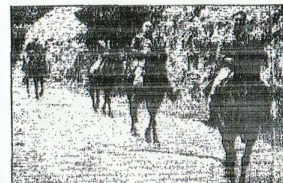
I colleghi in groppa ai loro destrieri

Il cavallo tor- na di moda, tra i giornalisti italiani, per ri- scoprire vec- chie vie, trat- tori, antichi bor- ghi, castelli, masserie e vec- chie abbazie.