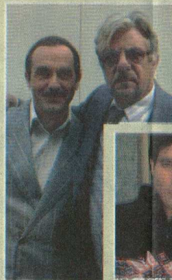
La storia girata tra i vicoli della città dei papi