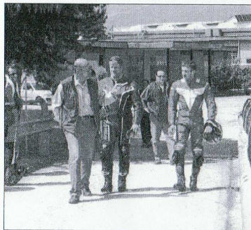
Piloti, automobili, da 300 cavalli e tanti curiosi nella struttura unica in Italia per i servizi che offre agli addetti ai lavori e non solo